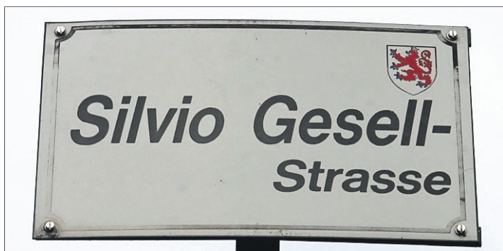
In St.Vith erinnert bis heute die nach ihm benannte Straße an den berühmten Sohn der Stadt.

Als Lösung dieser Missstände schlug Gesell die Einführung von nicht hortbaren »rostenden Banknoten« vor. Sie sollten Angebot und Nachfrage auf den Märkten in ein Gleichgewicht bringen, damit das Zinsniveau allmählich gegen Null absinken könne. Als Folge davon erwartete er Vollbeschäftigung, Geldwertstabilität, eine gerechtere Einkommensverteilung sowie